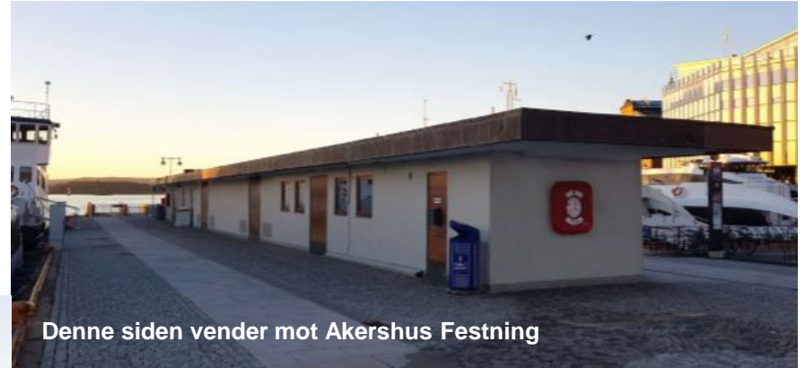
Denne siden vender mot Akershus Festning