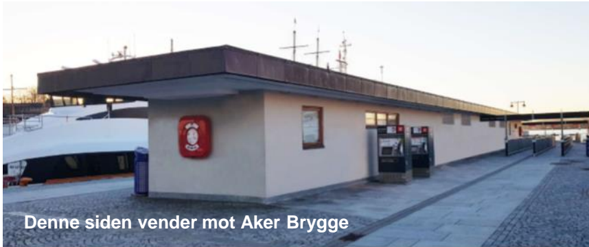
Denne siden vender mot Aker Brygge