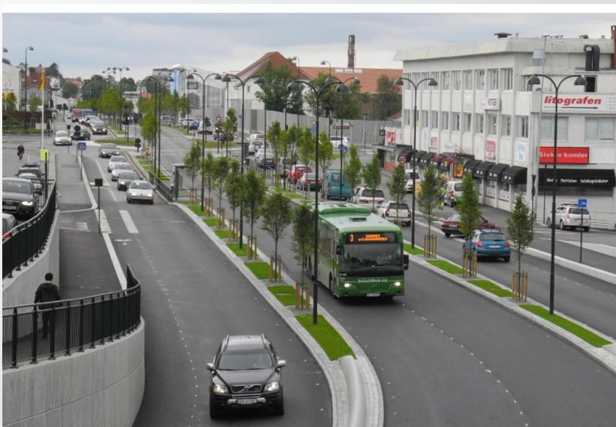
Høystandard bussløsninger med midtstilte, separate bussfelter gir forutsigbar kjøretid og kapasitet på nivå med skinnegående systemer. Stavangers bussvei