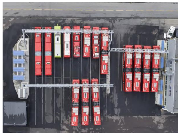
Figur 2 – Bilde Alnabru, sett ovenfra