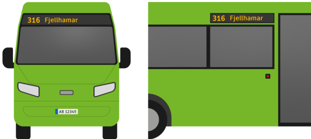
Figur 1 – Illustrasjon av skiltkasse med krav til minimum skrifthøyde henholdsvis foran (venstre) og sidene og bak (høyre).

Informasjonsflaten skal være dynamiske slik at man for eksempel kan vise flere linjeskift med tekst eller ha forskjellig størrelse på linjenummer og destinasjon.